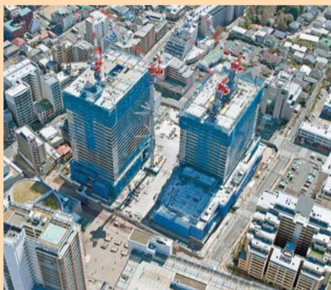
本体工事(平成31年3月現在)