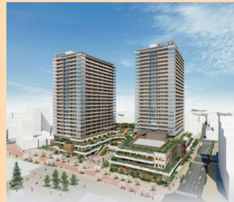
完成予想図(令和2年5月予定)