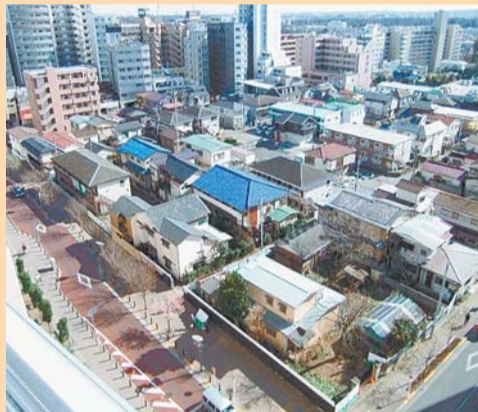
工事着手前(平成29年2月)