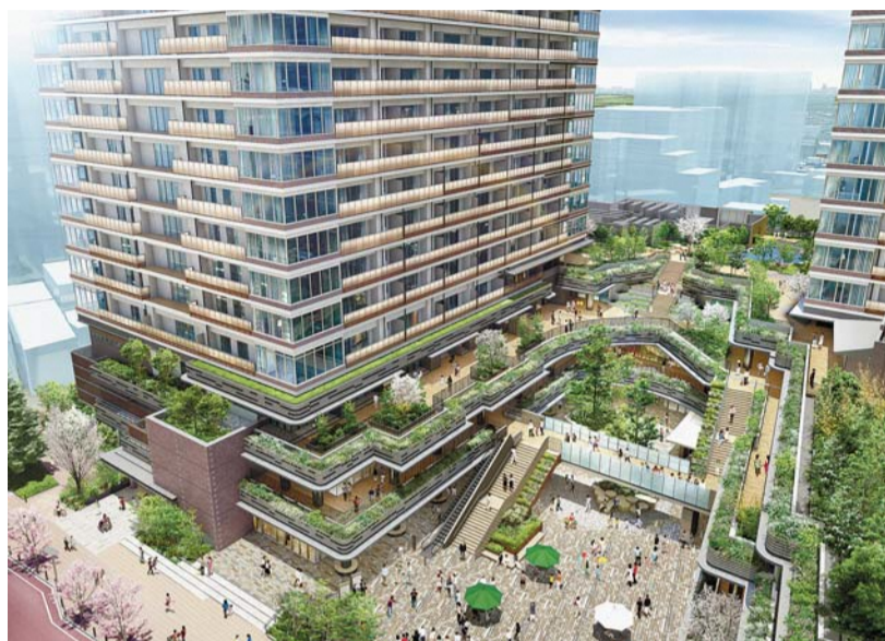
「はけ」をイメージした外観(令和2年5月予定)

問まちづくり推進課まちづくり係(☎042-387-9862)、武蔵小金井駅南口第2地区市街地再開発組合(本町6-9-35NOSA1会館3階☎042-316-4711)