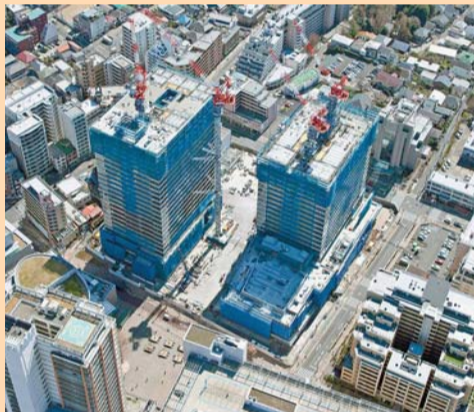
本体工事(平成31年3月現在)