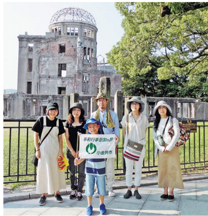
昨年の旅のようす

申 5月15日までに、電話または直接、広報秘書課広聴係(市役所第二庁舎1階☎042-387-9818)へ