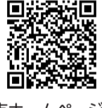
市ホームページQRコード

【長期計画審議会の開催】 長期計画審議会は毎月開催しています。これらの市民参加の情報は市ホームページをご覧ください。 【「高校生世代ワークショップ-アオハルカイギ」傍聴者募集】 時 7月17日(水)午後5時~7時30分 所 市民会館・萌え木ホール 定 10人(申込順) 他 手話通訳あり(要事前申込) 申 7月16日正午までに、電話またはファクスで氏名・連絡先を企画政策課へ