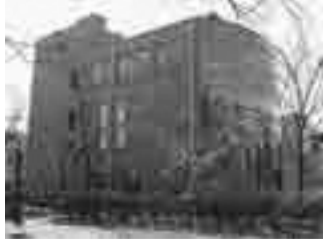
栗山公園健康運動センター