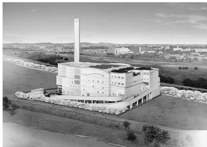
新可燃ごみ処理施設(イメージ図)