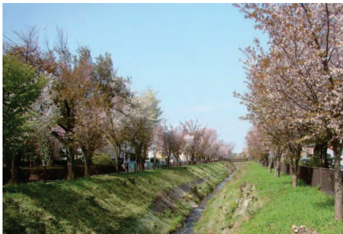
関野橋付近より平右衛門橋を望む (令和3年4月撮影)