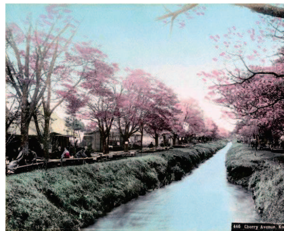
小金井橋付近の花見 (明治期製作の手彩色写真)

日時:令和6年5月29日(水) 午後2時から 場所:小金井市役所本庁舎3階 第一会議室