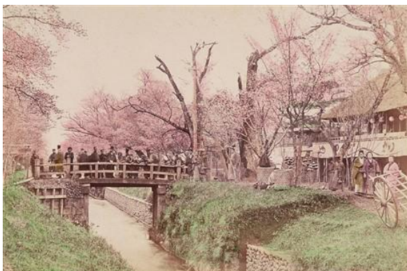
手彩色写真「小金井橋の景」(明治時代後期)

1924年、花見時期に小金井村に臨時 停車場ができ、1926年に正式に武蔵 小金井駅が開業(小金井仮乗降場設置か らも100周年)