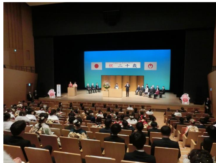
二十歳を祝う会のようす