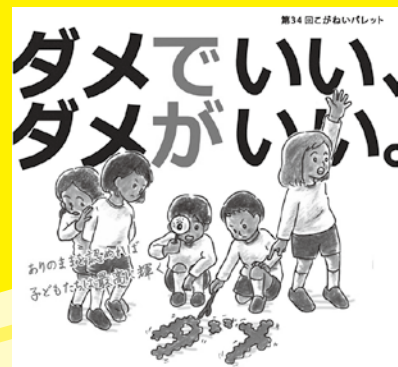
第34回こがねいパレットポスター

今回は、教育分野で活躍されている講師に、子どもたちとの関わり方や居場所づくりについてお話いただきましたので、その一部をご紹介します。