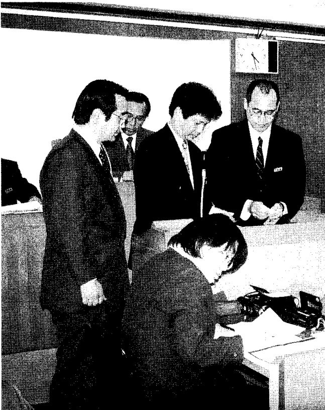
4月16日に行われた議長選挙の開票風景

また、議員提出議案の「市議会委員会条例の一部を改正する条例」、「議会運営委員会条例の一部を改正する条例」及び「選挙妨害のない公明正大な選挙を行うことを求める決議」を原案のとおり可決し、平成12年度の「一般会計補正予算(第8回)」、「国民健康保険特別会計補正予算(第3回)」、「下水道事業特別会計補正予算(第4回)」及び「市税賦課徴収条例の一部を改正する条例」については、市長から専決処分をした旨の報告がなされ、承認しました。