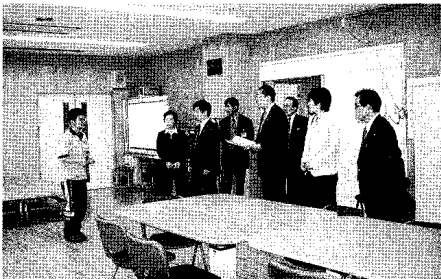
障害者福祉センター

今臨時会では、専決処分4件を承認、議案1件を同意、議員案3件を原案可決しました。 《承認した案件》 ▼専決処分の報告及び承認について (平成12年度東京都小金井市一般会計補正予算(第8回)) ▼専決処分の報告及び承認について (平成12年度東京都小金井市国民健康保険特別会計補正予算(第3回)) ▼専決処分の報告及び承認について (平成12年度東京都小金井市