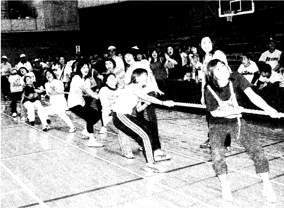
応援する方も思わず力が入ります(市民綱引き大会・10月8日総合体育館)

小金井市ホームページアドレス http://www.city.koganei.tokyo.jp/