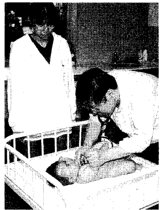
お母さんが見守る中で乳児検診 (保健センターで)