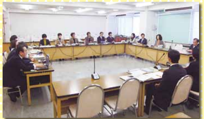
活発な議論がとびかう議会基本条例策定代表者会議の様子