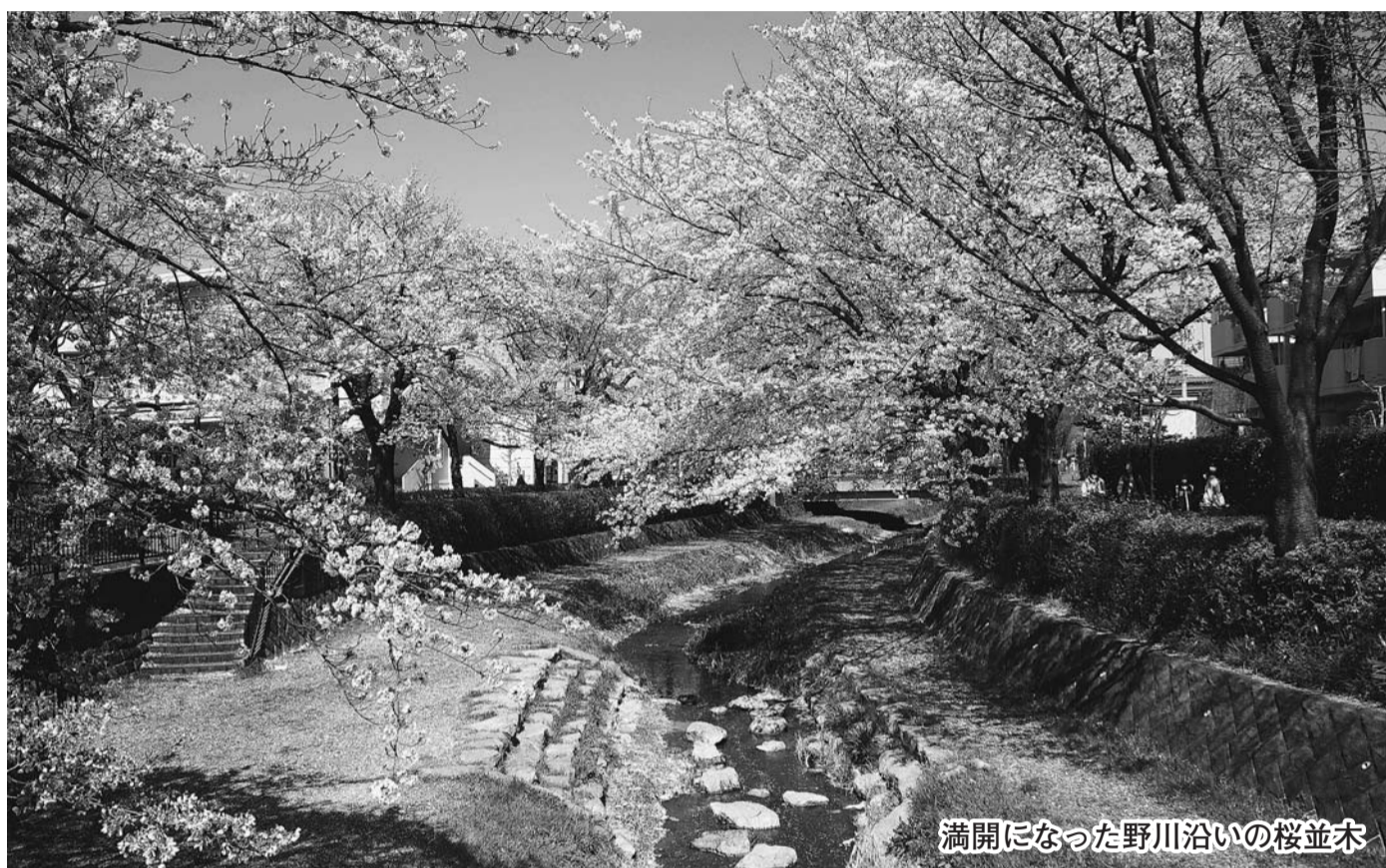
満開になった野川沿いの桜並木