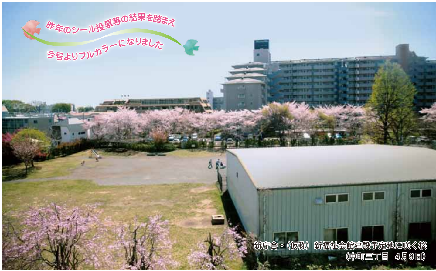
新庁舎。(仮称) 新福祉社会館建設予定地に咲く桜 (中町三丁目 4月9日)