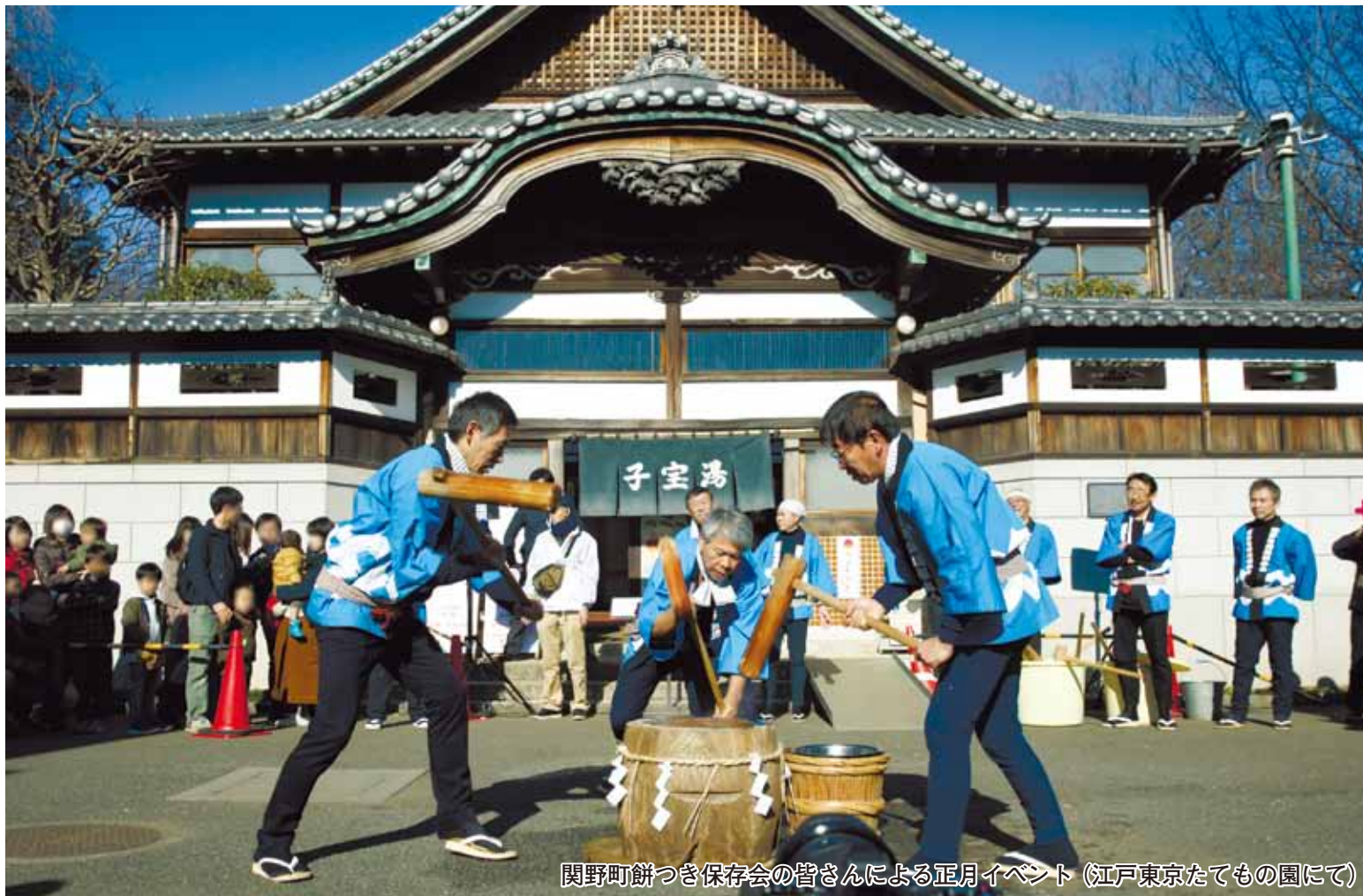
関野町餅つき保存会の皆さんによる正月イベント(江戸東京たてもの園にて)