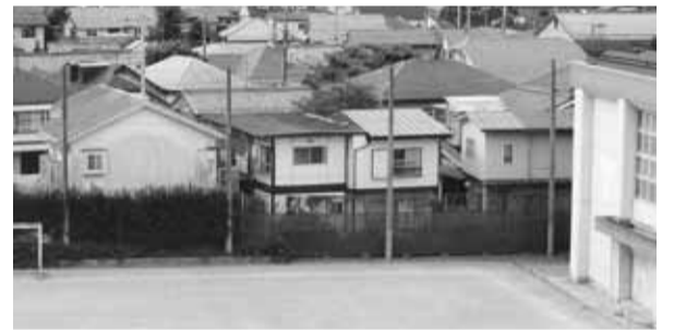
野球にサッカー、ボールをキャッチ、防球ネット!

●提供される速報について、全国瞬時警報システムから防災行政無線に直結して、自動的に警報を鳴らしてはどうか。また、各種情報サービスをjつて、市役所や学校等の施設