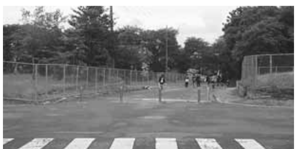
貫井北町国家公務員住宅の建設予定地

実施し、ゆとりを作りたい。椅子の件は工夫してみたい。(ウ)団体利用は多いが個人利用が少ない。周知をし利用促進をしたい。(エ)調査し改善したい。(オ)開館準備作業を見極め、検討課題としたい。