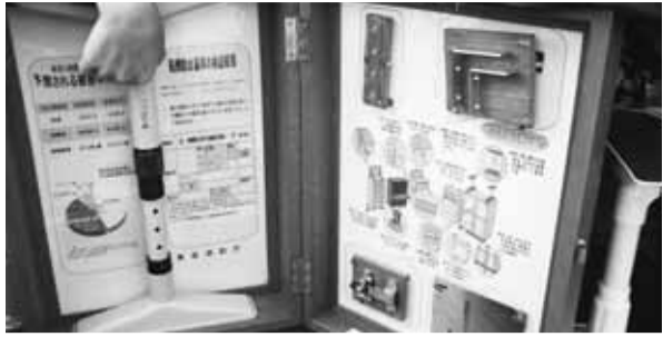
総合防災訓練で展示された転倒防止器具