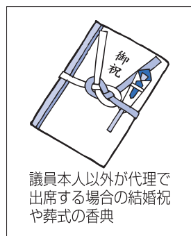
議員本人以外が代理で出席する場合の結婚祝や葬式の香典