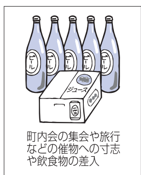
町内会の集会や旅行などの催物への寸志や飲食物の差入