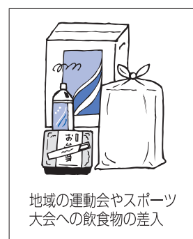
地域の運動会やスポーツ大会への飲食物の差入