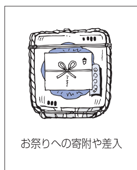
お祭りへの寄附や差入