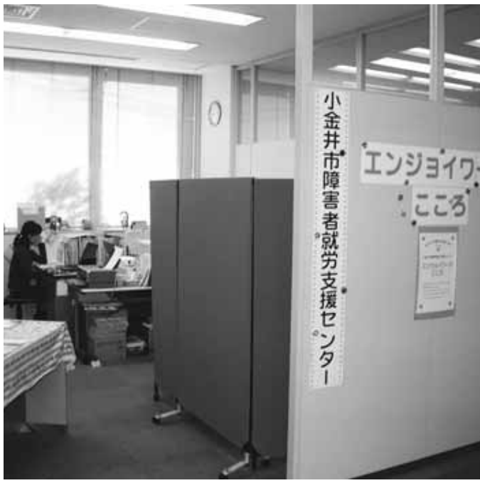
第二庁舎の1階に開設された障害者就労支援センター

また、再任用短時間勤務職員(週30時間)の給料を、他市との均衡を考慮して平成20年4月から給料月額16万930円を18万8千100円とするものです。