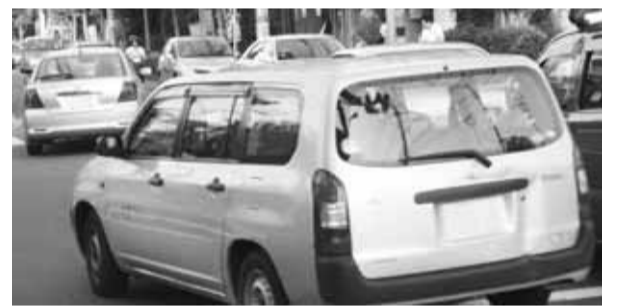
右折車で混雑する北大通り

前に本町二丁目交差点は、小金井街道拡幅の隅切りにより3台分程の待機レーンが出来る。緑中央通りとの交差点は、同道路の拡幅の中で植栽帯を切りつめて20メートル程度の右折レーンが出来る。三小前交差点は東大通り拡幅に伴い同様な右折レーンが取れると思われる。また、交通管理者と協議し時差式信号機設置等に対応したい。(ウ)東京都から「交差点すいすいプラン」で2分の1の補助金が出るのでそれを活用し整備したい。