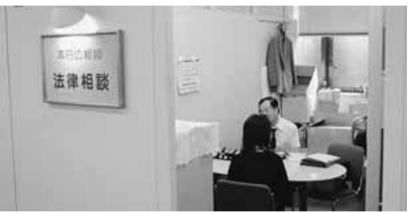
心の相談にも対策を

お願いをしている。市民の皆様にご理解をいただきたい。 介護福祉課長 (イ)必要な方には介護予防の訪問介護、ホームヘルプを使っていくこともできる。 ②教育振興費はこの数年間、横ばいの予算措置となつてい。少なくとも、義務教育に直接関係する教材費、副教材費、学用品費などの保護者負担は軽減すべき。 学校教育部長 予算の増額はなかなか難しいところ。研究していきたい。