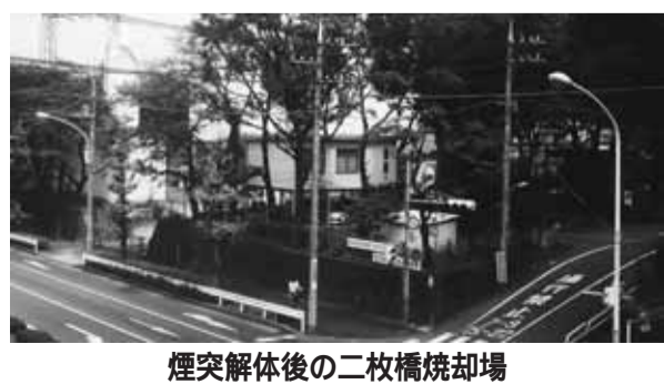
煙突解体後の二枚橋焼却場

する方法を早急に検討すべきである。(イ)28年度以降の中期計画の処理方法は焼却方式にこだわらず、プロポーザルなどにより広く技術を求めるべきである。(ウ)白老町では実験の結果により非焼却の「加水分解」による施設を建設中である。見解を求める。 市長 (ア)国分寺市と結んだ