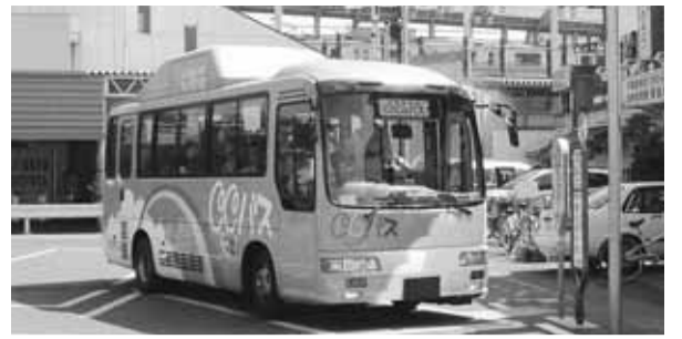
市民の足として親しまれるココバス