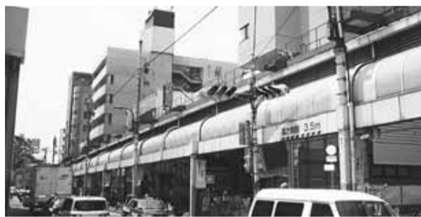
既存ビルがある第二地区

議決が必要。11万市民の市役所をどうするかという問題を議会にも報告しないで進めるのはおかしい。 開発事業本部長 地元で話し合っているイメージ図である。地元の理解を得ながら議会に出したい。 ② 市庁舎を入れるのは市の方針。地権者がそれを採用する