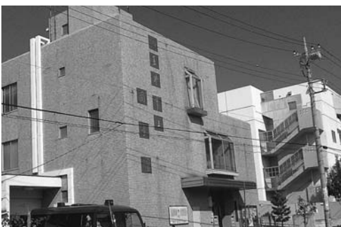
整備が望まれる図書館