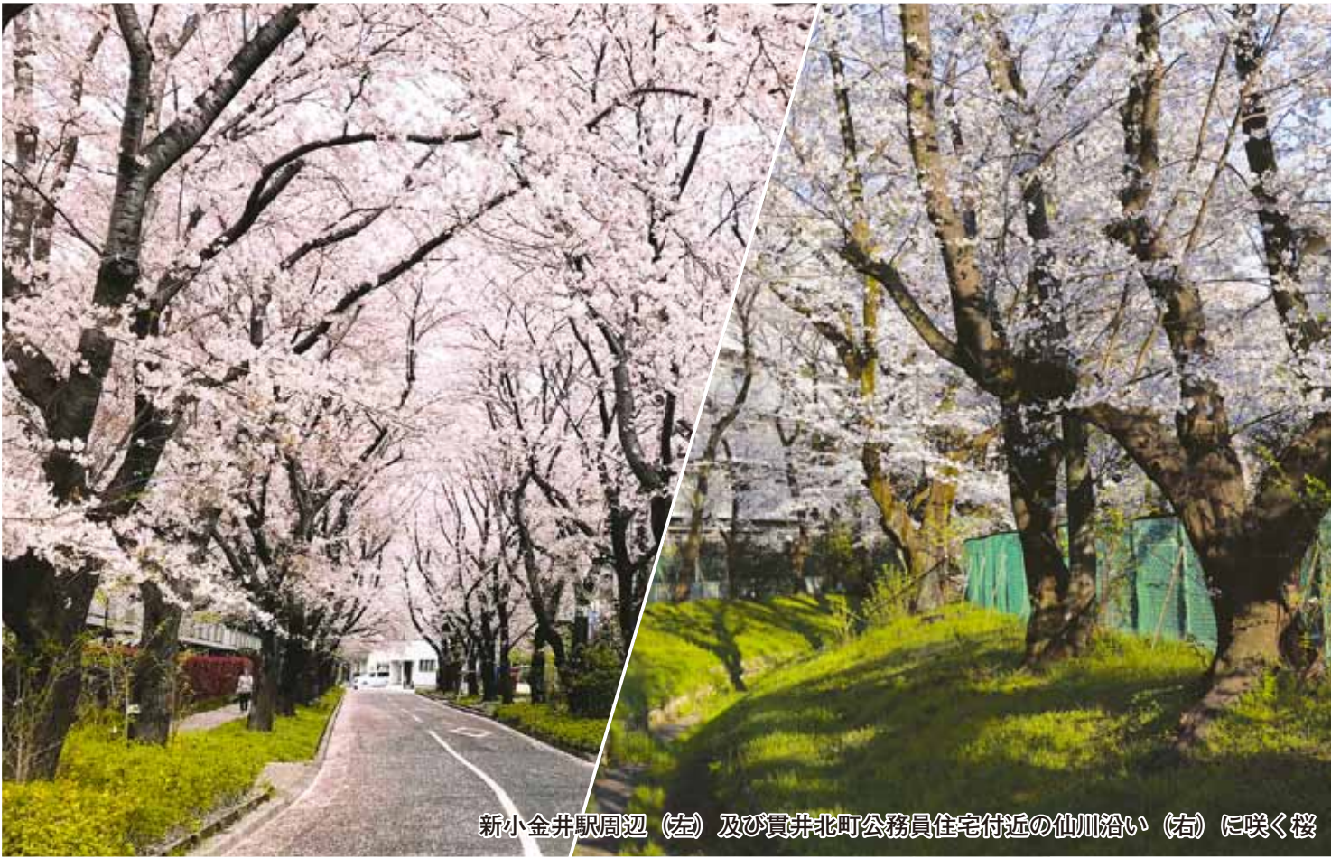
新小金井駅周辺(左)及び貫井北町公務員住宅付近の仙川沿い(右)に咲く桜