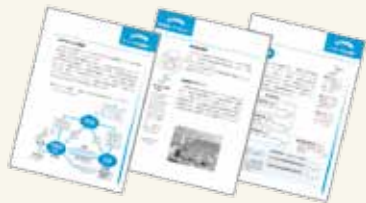
ホームページに掲載しています