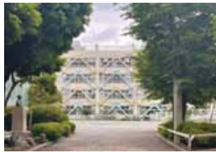
一小、三小、東小、緑小は緊急的に増改築の対応が急務。学校施設の在り方は？

部長 (ア)今後の建て替えの際に学校と相談し多様な居場所づくりに配慮したい。(イ)他区市の取組は確認する。今後の大幅な更新に当たっては文部科学省の提言なども参考に議論したい。(ウ)現在検討中の基本計画が一定まとまった段階で、説明や周知の方向について学校とも協議しながら検討したい。