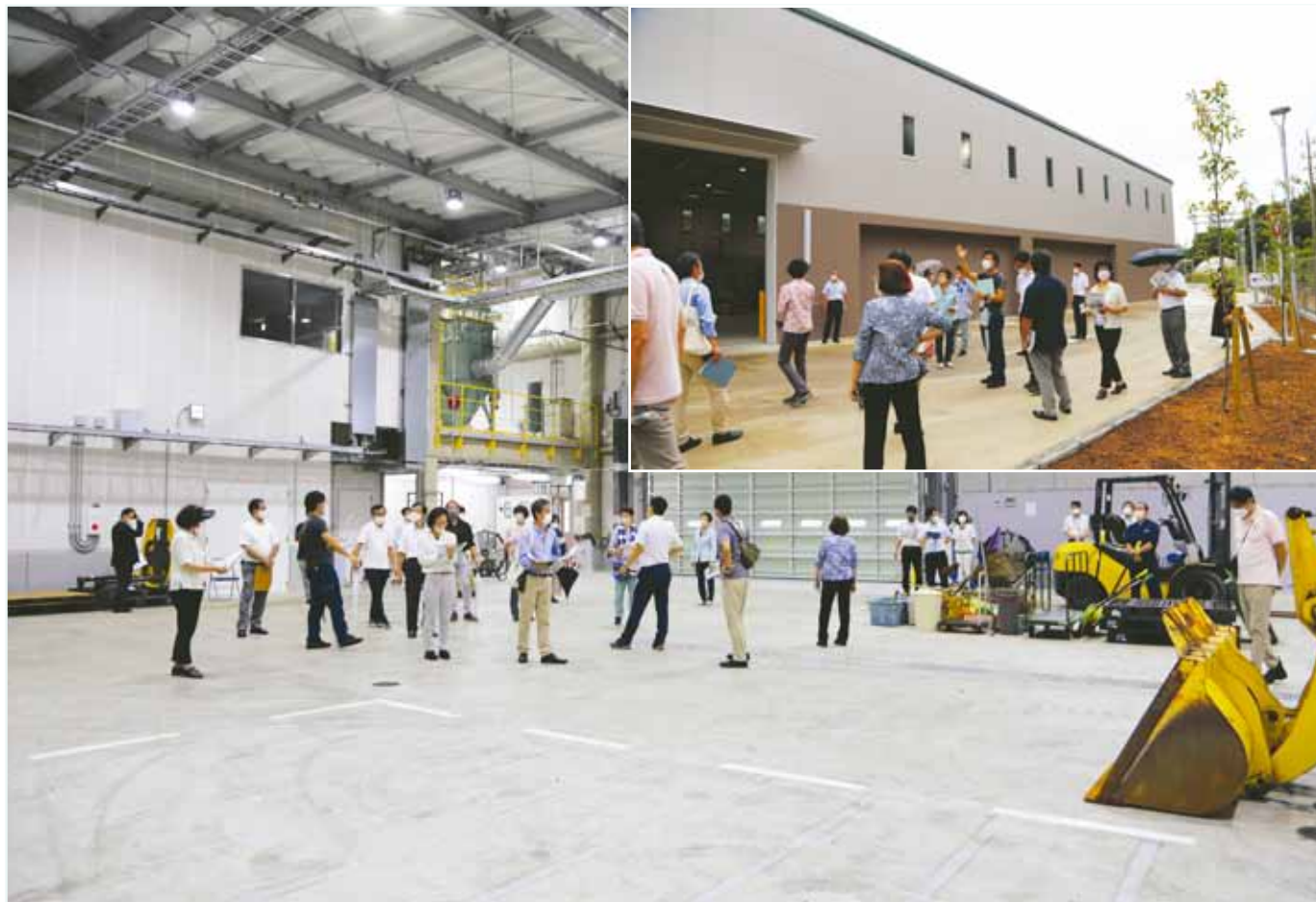
野川クリーンセンター内覧会の様子(8月1日から本格稼働した不燃・粗大ごみ積替え・保管施設)

「市民意向調査(市民アンケート)」を対象の方へお送りしますので、ご協力をお願いします。 「(仮称)市民との懇談会」を開催しますので、ご参加ください。 (詳細は7面に掲載)