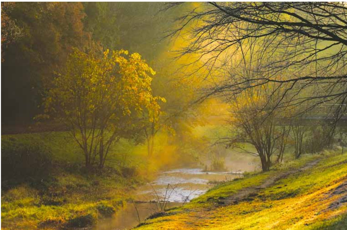
第69回小金井の四季の観光写真コンクール 推薦「晩秋の輝き」高橋 美奈子