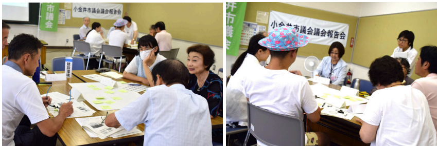
参加者は関心のあるテーマのテーブルを選んで着席。参加者同士の意見交換も。