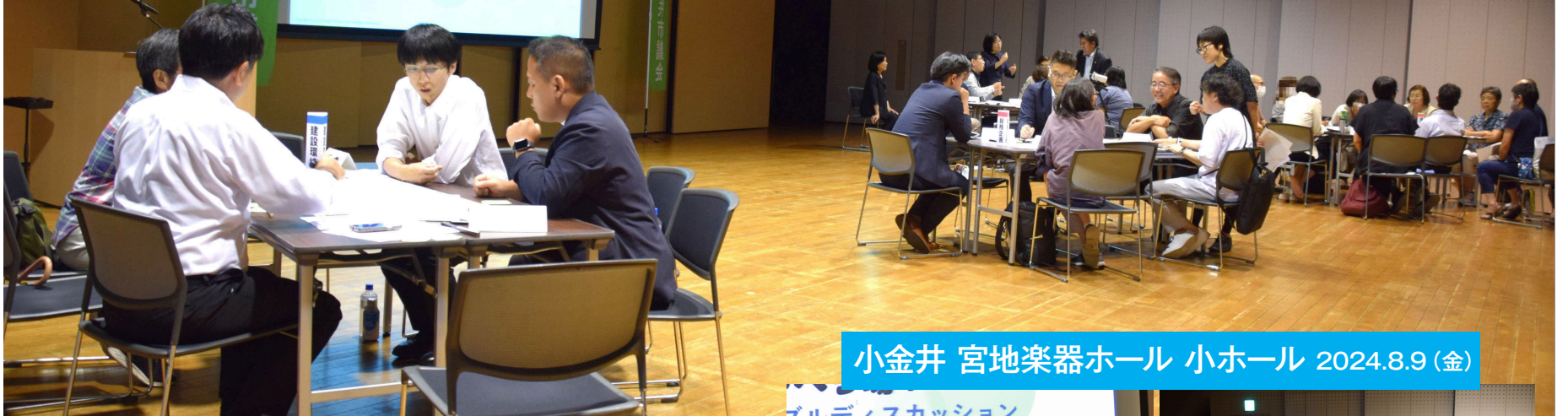
小金井 宮地楽器ホール 小ホール 2024.8.9 (金)

夏真っ只中の8月初旬、議会基本条例にのっとり、小金井市議会報告会「しゃべり場」を2会場で開催し、それぞれ13名の方にご参加いただきました。「しゃべり場」というタイトルには、参加者同士が市政について気軽に意見交換できる場を作りたい、という思いをこめました。10代から70代の幅広い年代の方に参加していただきました。各会場同内容で、第1部は4つの委員会からそれぞれテーマを決めて各8分間で報告を行い、第2部は委員会ごとのテーブルで議員を交えて意見交換を行いました。開催前の議員研修会で議員全員がファシリテーション研修を受け、テーブルトークに臨みました。