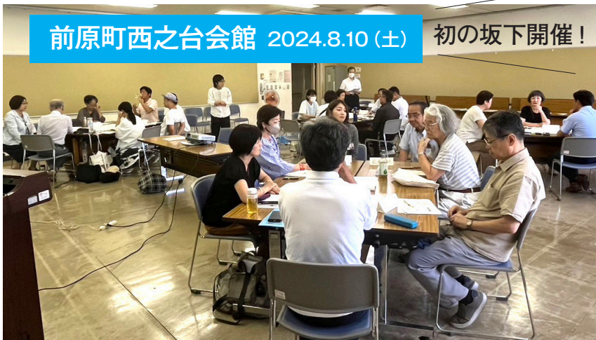
前原町西之台会館 2024.8.10 (土) 初の坂下開催!