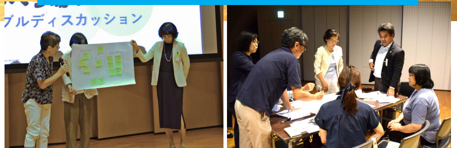
議員と市民を交えてテーブルトークを行い、最後に短くまとめを発表しました。