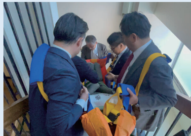
急きょ布担架チームを結成し搬送