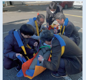
無事に駐車場へ到着

訓練を終えて一言：「事前の布担架訓練が役に立った」「布担架のメリットを見出せた」「ハプニング要素の盛り込みは良かった」