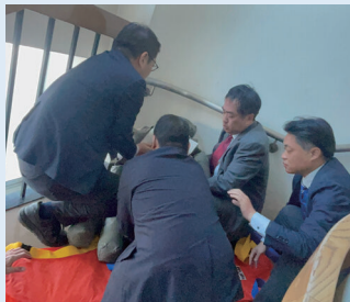
3階踊り場で要救助者に遭遇