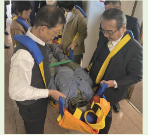
掛け声で一気に持ち上げ安全な場所へ避難

訓練を終えて一言：「重さの負担はなかった」「移動も問題なくできた」「布担架は事務局入口の左手に常備されていることが認識できた」