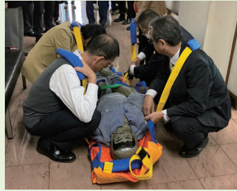
搬送者が持ち手を握り肩ストラップを掛け