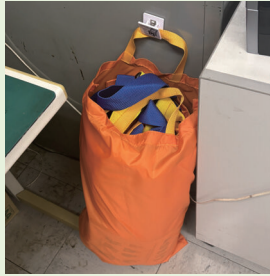
広げる前の「布担架」常備場所も確認