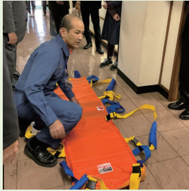
消防署による広げ方と使い方指導