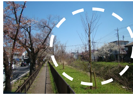
整備後 雑木の伐採 サクラの植樹