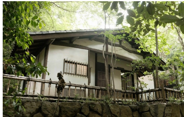
右上 旧中村研一邸茶室(花侵庵) 外観 南から