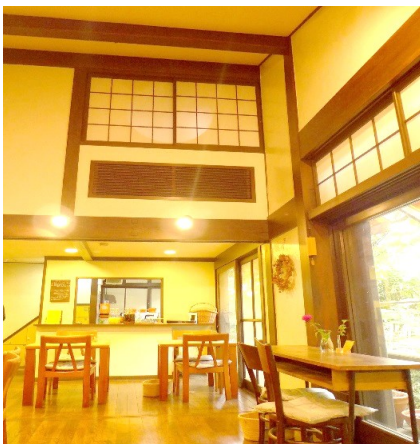
左 旧中村研一邸主屋 内部