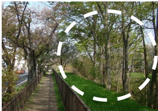
整備前 雑木の繁茂 被圧されるサクラ