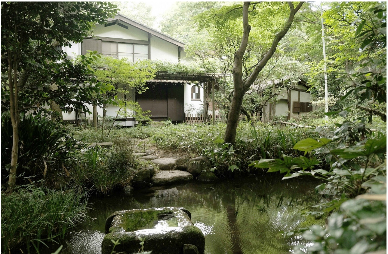
上 旧中村研一邸主屋 外観 北から