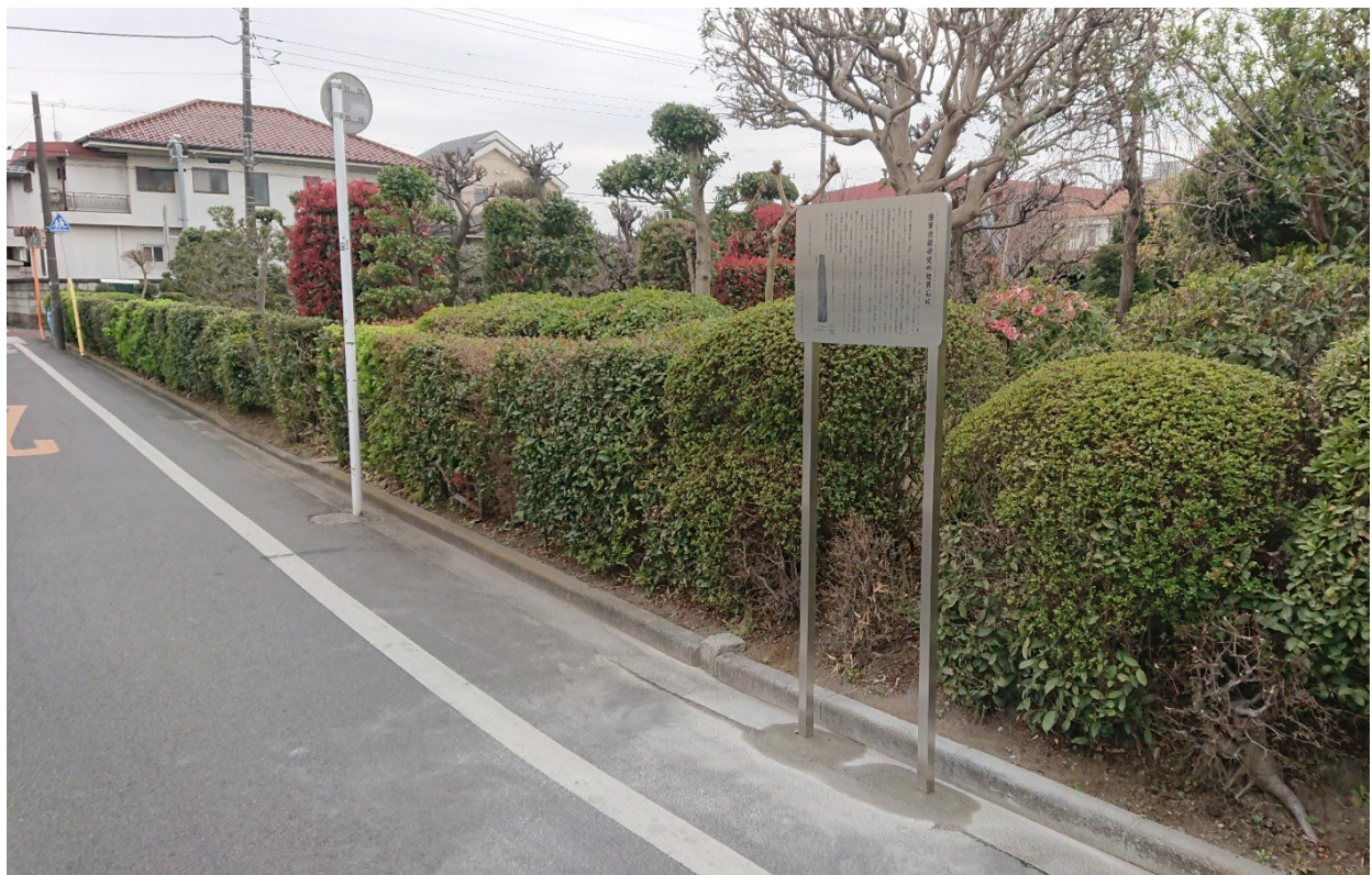
説明板設置状況 東から