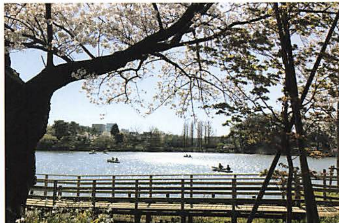
【洗足池公園】(大田区)

洋画家中村研一の旧宅です。吹き抜けのある居間を中心とした開放感のある建築で、多摩川から湧き出た水を利用した庭園の中には茶室(花侵庵)もあります。敷地内には小金井市立はげの森美術館が併設されています。