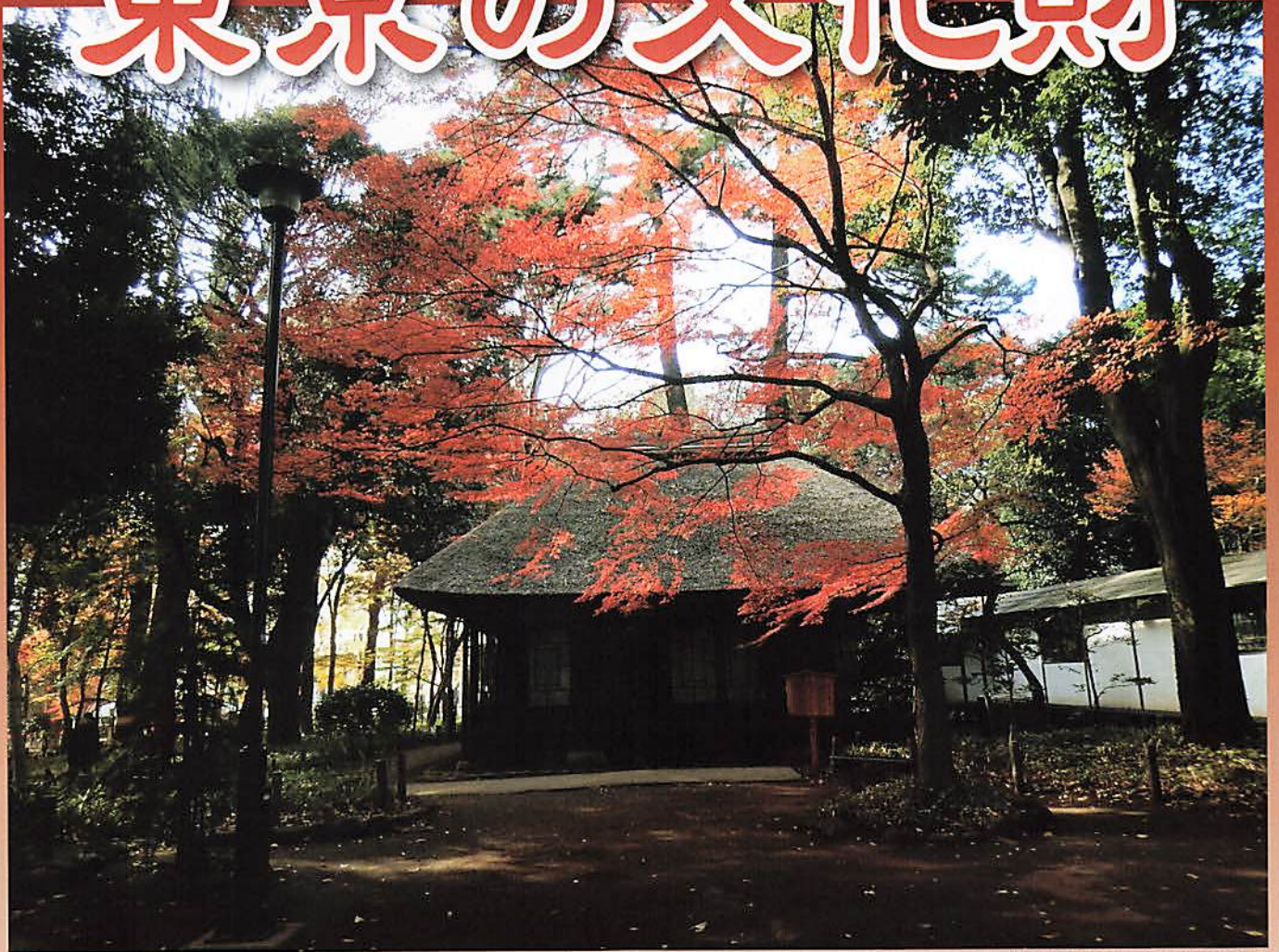
徳富蘆花旧宅（蘆花恒春園）