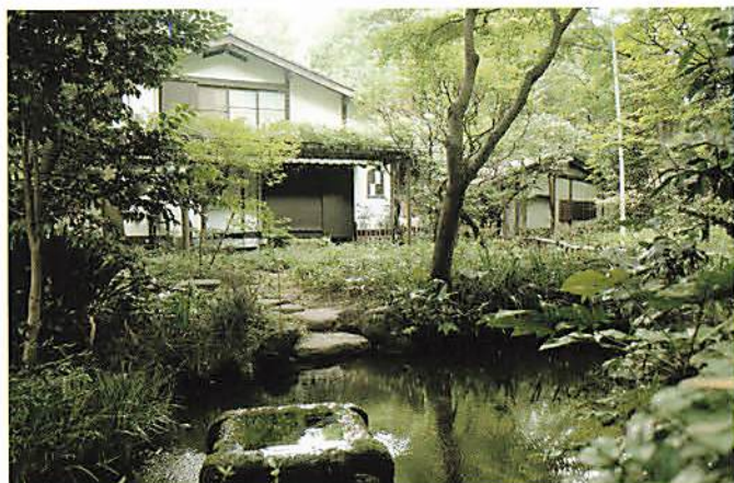
【旧中村研一郎】(小金井市)

今年度から新しく東京文化財ウィークに参加することになった文化財の一部を紹介します。