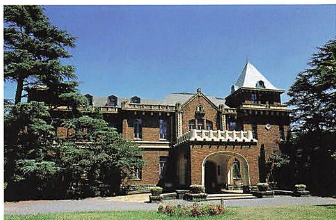
【旧前田家本邸(洋館)】

各イベントについて、具体的な内容や会場へのアクセス等、より詳しくは、「東京文化財ウィーク2019ガイドブック特別公開・企画事業編」を御覧ください。