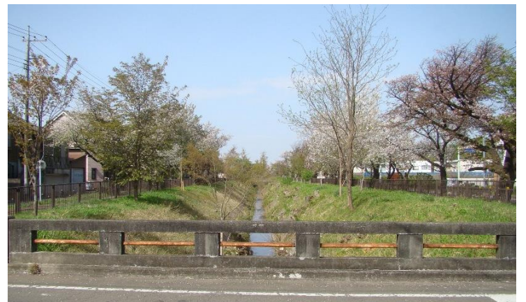
3. 新小金井橋から上流方向 (整備前 → 令和3年春)