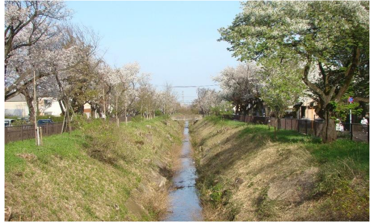
2. 陣屋橋から下流方向 (整備前 → 令和3年春)