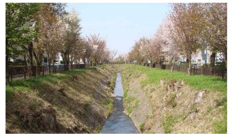
4. 関野橋から上流方向 (整備前 → 令和3年春)