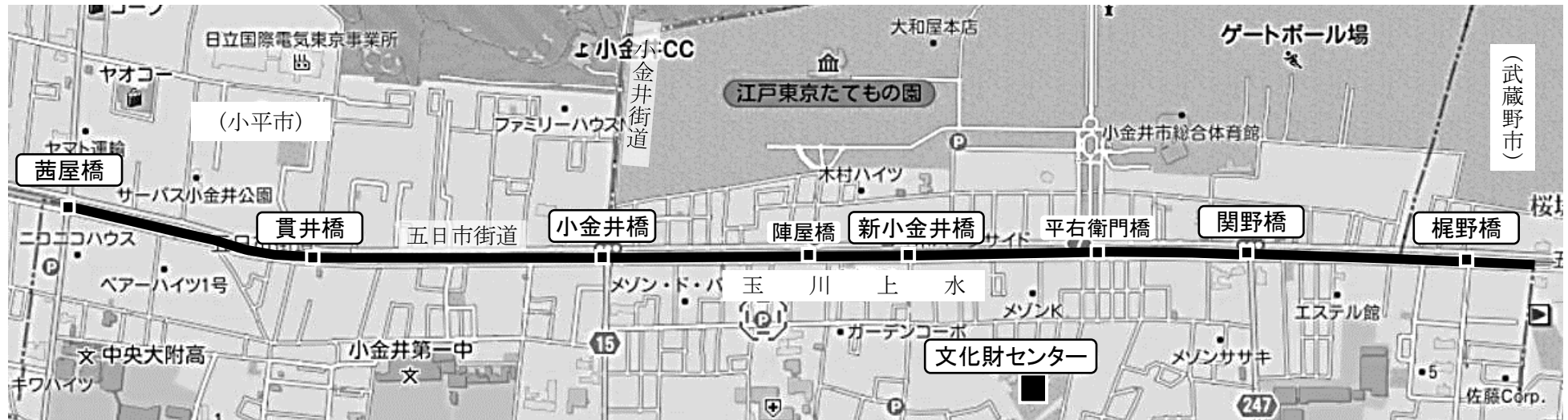
玉川上水沿線図(小金井市)