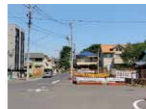
車道及び歩道を整備