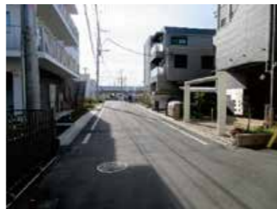
すれ違いができなかった道路を解消