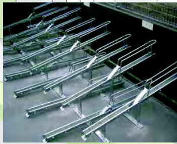
駐輪ラックイメージ