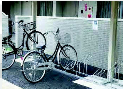
駐輪ラックイメージ