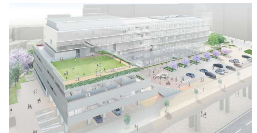
庁舎と(仮称)新福祉社会館が重ね合わさり構成される外観イメージ